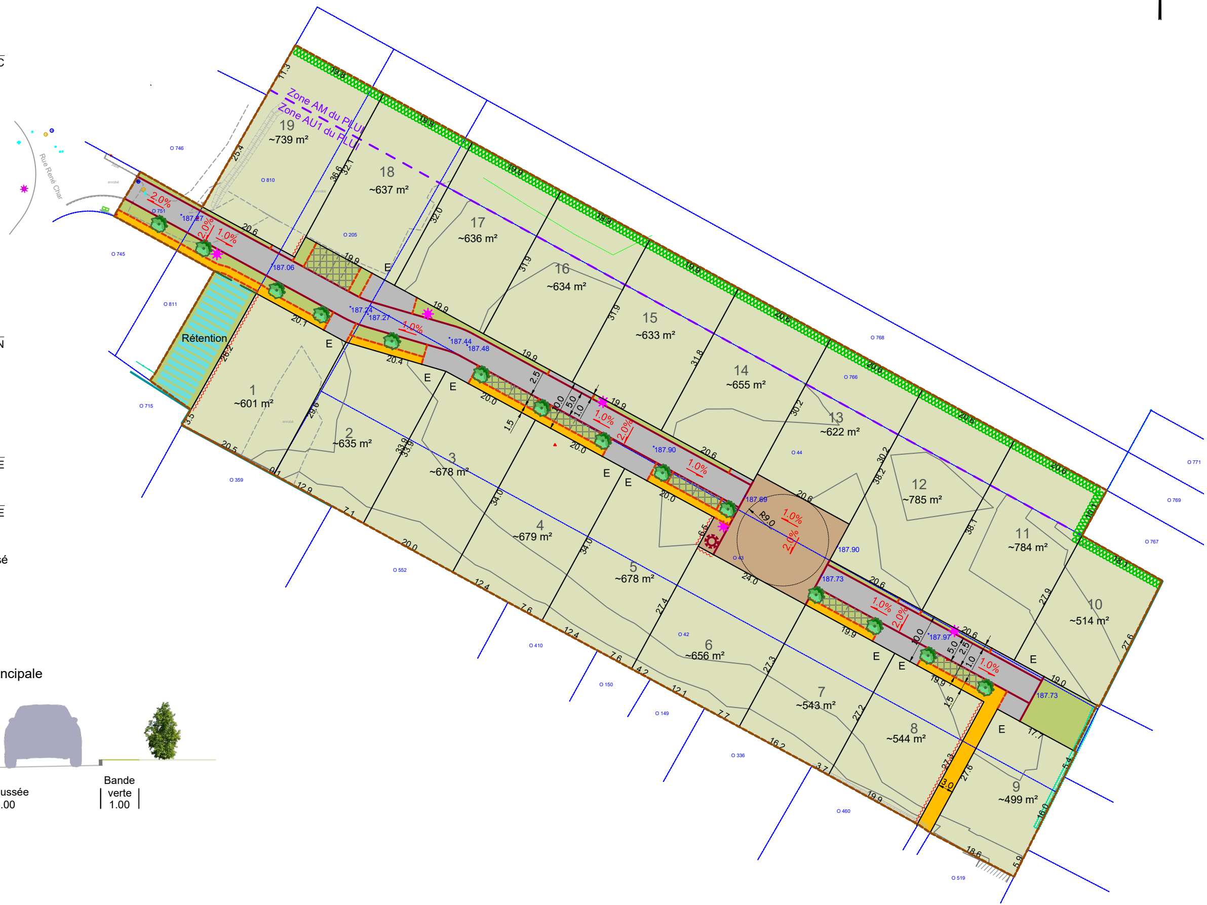
Coupe type de la voie principale